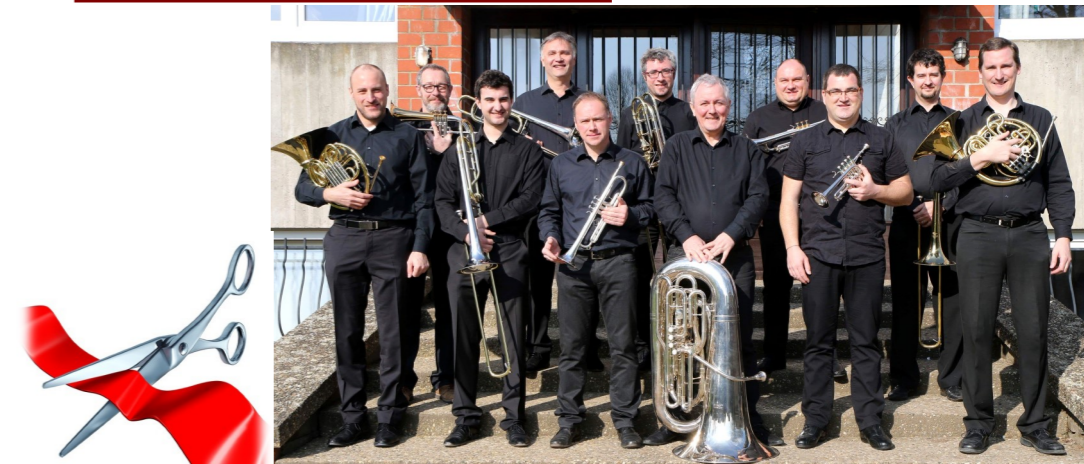
L'ensemble de cuivres qui coanimera la célébration.

Le conseil de fabrique vous invite cordialement à cette cérémonie qui sera suivie d'un vin d'honneur offert par l'Administration Communale.