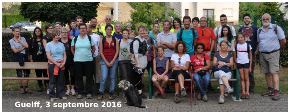
Guelff, 3 septembre 2016